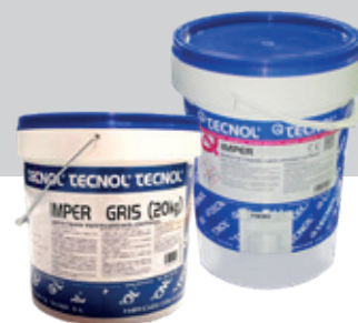
Lámina líquida impermeable elastómera

Resina semifluida acrílica para impermeabilizar cubiertas y otros elementos constructivos.