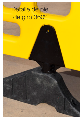
Detalle de pie de giro 360°