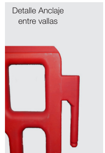
Detalle Anclaje entre vallas