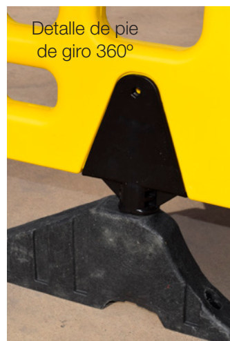
Detalle de pie de giro 360°