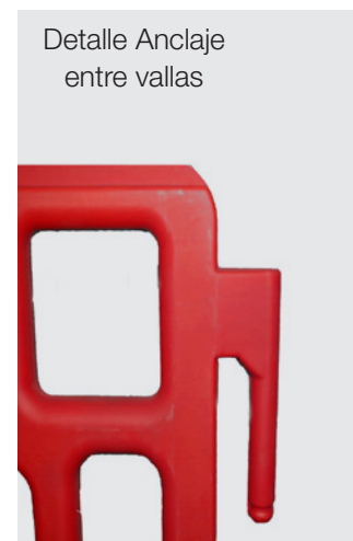
Detalle Anclaje entre vallas