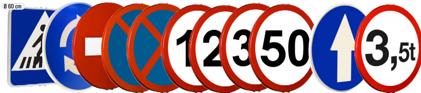
PEATONES ROTONDA ENTRADA PROHIBIDA ESTAC./ PARADA/ESTAC. PROHIBIDO VELOCIDAD MÁXIMA 10/20/30/50 SENTIDO OBLIGATORIO LIMITACIÓN PESO 3,5t