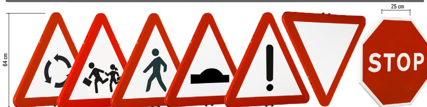
INTERS. CON CIRC. GIRATORIA ZONA ESCOLAR PASO DE PEATONES RESALTO OTROS PELIGROS CEDA EL PASO STOP