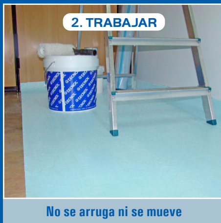
No se arruga ni se mueve