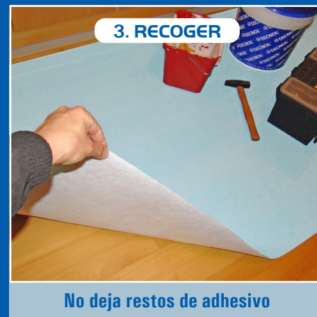
No deja restos de adhesivo

Barrer antes de desplegar TQ PROTEC FLOOR. La cara blanca hacia abajo.