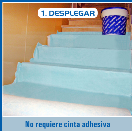
No requiere cinta adhesiva