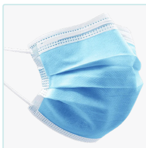
MASCARILLA QUIRÚRGICA TIPO IIR