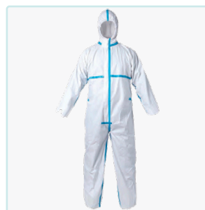
BUZO IMPERMEABLE CAT.III TIPO 3B-4B