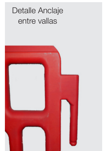
Detalle Anclaje entre vallas