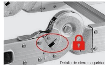
Detalle de cierre seguridad